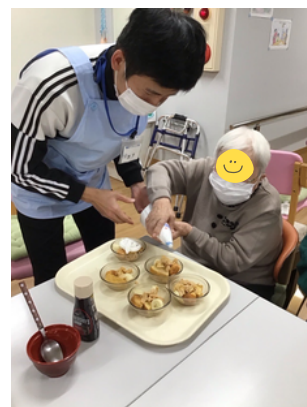
一緒におやつ作りを楽しんで