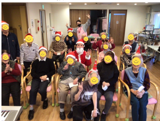
笑顔あふれる一年となりました