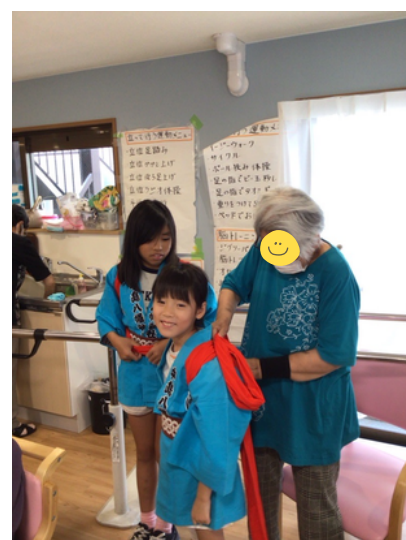
法被を着せてもらいました