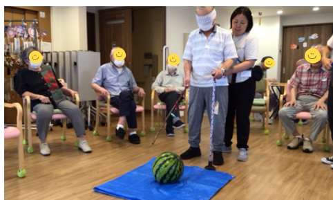
暑い夏は風鈴市見学を断念