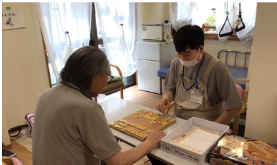
午後のひとは将棋を教えて頂いて