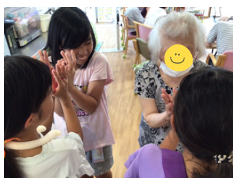
あやとり教えてくださーい！