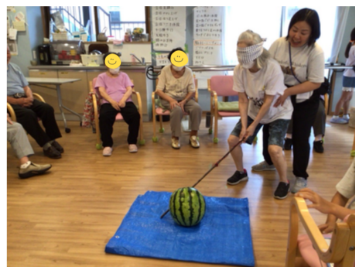
えい！掛け声が聞こえてきそう！