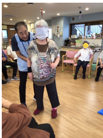
スイカ割りは大盛り上がりでした