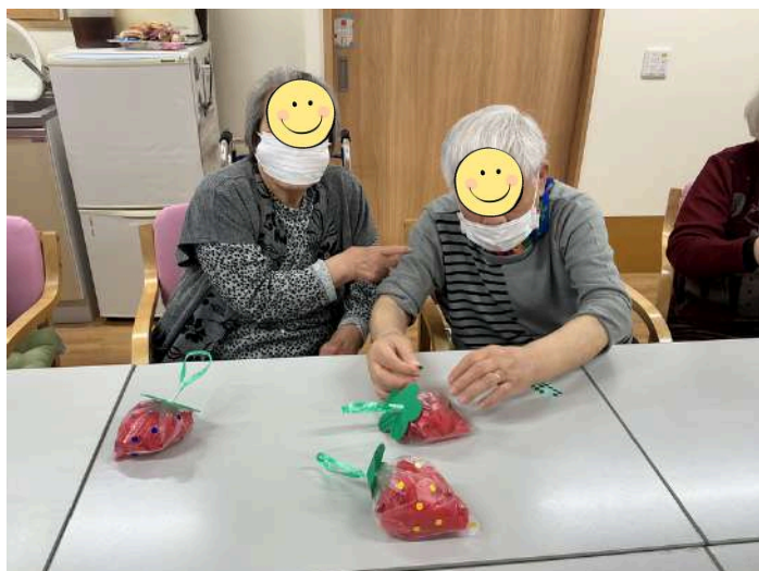
みんなていちご飾り