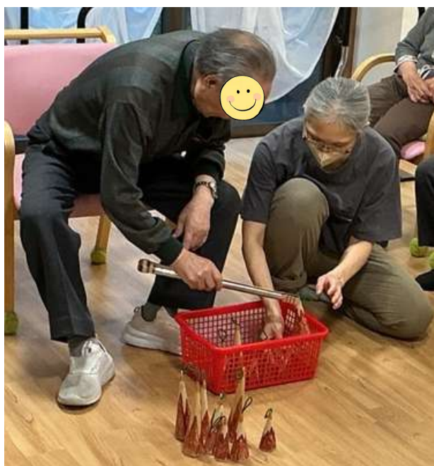
心がうごけば身体もうごく

また、運営の中で見えてきた課題についても、その都度話し合いを重ね、改善に努めてまいりました。これからも、ご利用者様が快適に過ごせる環境づくりと、在宅生活を支える支援に取り組んでまいります。柳田デイケア時代から続く「朝の会」や体操、立ち座り運動も継続して行い、ご自身でできることを大切にしながら、日々の生活力向上につなげてまいります。