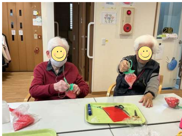
力を合わせて作ります

移転当初は、スタッフ・ご利用者様ともに戸惑う場面も多くありましたが、一年が経ち、新しい環境にも慣れ、日々安定したサービスを提供できるようになりました。