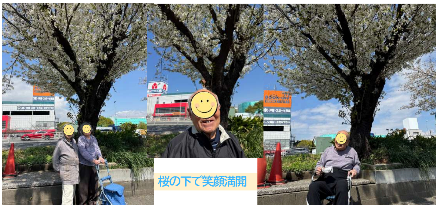
桜の下で笑顔満開

令和7年4月13日、中島から旭町へ移転オープンしてから早くも一周年を迎えました。これもひとえに、ご利用者様・ご家族様・地域の皆様の温かいご理解とご支援の賜物と、スタッフ一同心より感謝申し上げます。