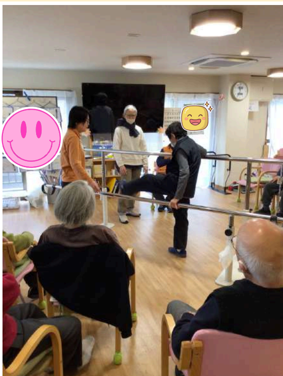
私もやってみたいわ!