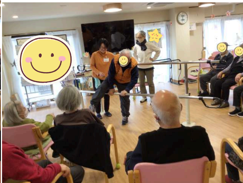
チャレンジしてみたい(^^♪