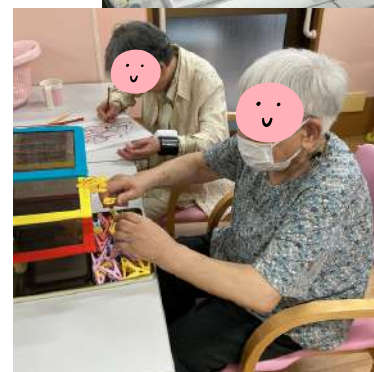
1階利用者さんの手作り作品(^_^)